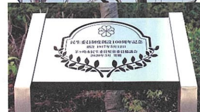
民生委員制度創設100周年 記念事業として 「しだれ桜」と「記念プレート」 を市へ寄贈しました