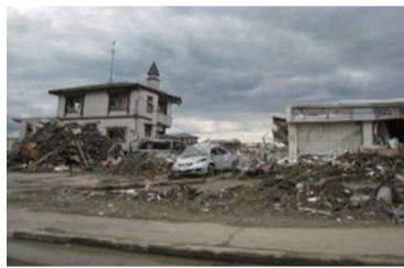
津波により数々の家屋が倒壊した宮城県石巻市内(2011年4月21日撮影)

この震災で経験した、災害への備えの重要性や地域の絆の大切さなどを思い返し、防災意識を高め、災害に対する準備を見直しましょう。