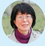
ちがさき男女共同参画推進プラン協議会委員としても活動

LGBTをテーマとした映画上映会や学習会を企画する活動をしています。中学生の頃、同性婚が許されていないことを知り、LGBTであることに悩みましたが、誰かに愛情を持つことは間違っていないと思って生きてきました。LGBTの場合、医療機関にかかるときやパートナー亡き後など人生の節目で、法的な保障がなく困難に直面します。そのため、強い信念や知識・人脈などがなくて生きていけない現状があります。パートナーシップ制度の導入が、生きづらさの解消につながればと思います。