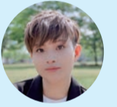
社会的マイノリティな人々に寄り添う活動を行う

私は、聴覚障がいとLGBTのダブルマイノリティの生きづらさの経験から、現在の活動をしています。周囲の人も当事者も生きやすくなるよう、たくさんの情報や選択肢があることが大切です。幅広い年代の方に障がいもLGBTも受け入れてもらっており、茅ヶ崎は多様性を生かしている環境だと思っています。