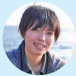
映画制作コミュニティ「マルア」の企画・運営を行う

制作する映画のテーマは、LGBTを特別視してほしくない、異性愛も同性愛もあります。中学生の頃にLGBTであることに気づきました。20代後半で母親に伝えると、「ちいの子の好きなように生きればいいよ」と言ってもらえました。パートナーシップ制度の認知度は低く、知ることが大きな一歩です。