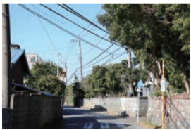
ゆったりとした雰囲気味わえる

「移りゆく季節を楽しめる「トトロ道」 寒川町田端にある大曲田端6号線。この東西に延びる道とその周辺の道は、畑や石垣・生け垣に囲まれており、そのどかな風景が映画「となりのトトロ」を連想させることから「トトロの道」と呼ばれています。