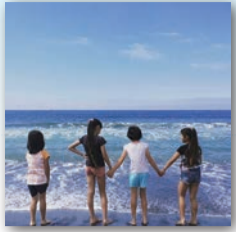
茅ヶ崎の海×思い出

投稿された一部の写真をパネルにし、3月28日まで茅ヶ崎ゆかりの人物館で、その後、市役所本庁舎市民ふれあいプラザで展示します(期間未定)。また、展示写真の投稿者を茅ヶ崎ゆかりの人物館にご招待します。