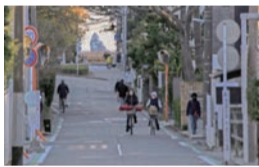
「お化けえぼし」を見ながらお散歩も

ラチエン通りには「お化けえぼし」といわれる不思議な現象があります。これは、通りから南に見える茅ヶ崎海岸沖合のえぼし岩が、離れるほどに大きく見えるというものです。現象のからくりは、周囲の木々や街路が縁縁の役割を果たし、目の錯覚が起きているためと考えられています。