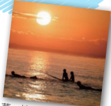
茅ヶ崎の海×初日の出