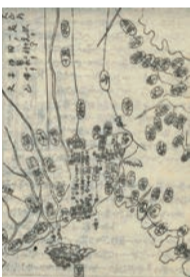
「諸国道中旅鏡」大山道図

「藤沢市」 多くの道が集まる藤沢宿 藤沢宿は東海道の江戸日本橋から数えて6番目の宿場です。江戸時代に藤沢の賑わいの中心だった藤沢宿の特色の一つに、多くの道が集まる場所であったことが挙げられます。それぞれの道の名前は、藤沢からの行き先の名前が付けられました。東海道を西へ行くと、城南の四ツ谷から北西に分かれる大山道(大山阿夫利神社・大山不動尊へ)、南へ下る江の島道(江島神社へ)、遊行寺前まで東へ向かう鎌倉道、北へ向かう八王子道(滝山街道)、北西に伸び