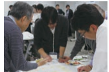
10代～80代の市民が参加

無作為に選ばれた市民同士が将来の都市像案をもとに、実現に向けた取り組みについて話し合いました。「地域内産業の活性化」や「生涯学習」に関する発言が多くありました。