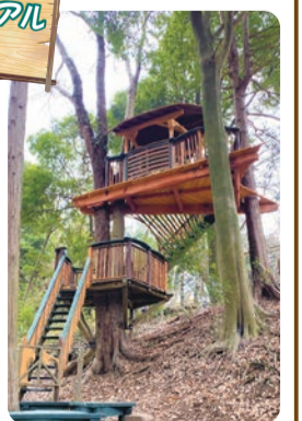
冒険心をかき立てる木の上の秘密基地

利用日時 5月～10月は毎日、11月～4月は土・日曜日、祝日いずれも10時～15時