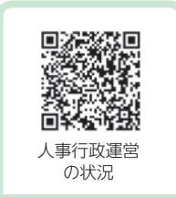
人事行政運営の状況

原則1年に20日の有給休暇が与えられます。2019年の職員1人当たりの取得日数は平均10.73日です。