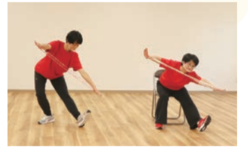
ひもやりボンを使った体操

外出の機会が減る中でも元気に過ごせるように、市独自の介護予防体操「えぼし麻呂とお茶の間体操」の動画を作成しました。自宅で身の周りにあるものを使ってでき、子供から高齢者まで年齢を問わず楽しめます。動画は12月5日(土)から市広報番組(本紙8面参照)で放送された後、YouTubeでも配信。動画をきっかけに、できる範囲で体を動かしてみましょう。