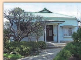
撮影は和洋折衷建築の「旧藤間家住宅」で