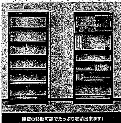
目板の移動可能でたっぷり収納出来ます!