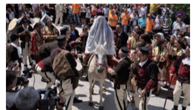
披露宴会場に迎えられる馬に乗った新郎

首都スコピエから120kmほど西にあるガルチェニツク村では、毎年7月12日(聖ペテロの日)前後の週末に、マケドニア伝統の結婚式「ガルチェニツクウエディング」が2日間にわたって行われ、世界中から観光客が訪れます。1936年から毎年村の出身者が選ばれ、式を挙げます。