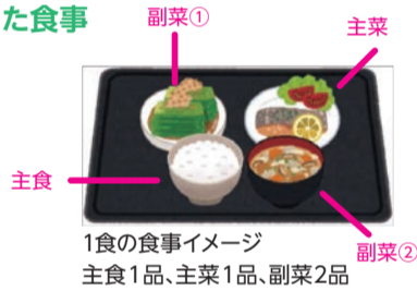
1食の食事イメージ 主食1品、主菜1品、副菜2品