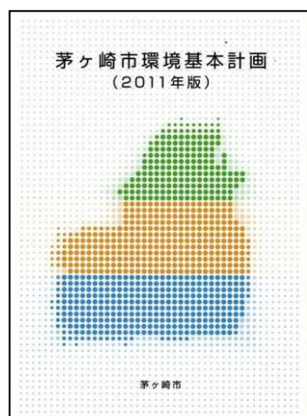
「茅ヶ崎市環境基本計画(2011年版)」 (平成 23 年 3 月策定)

「茅ヶ崎市環境基本計画(2011年版)」(平成 23 年 3 月策定)及び「茅ヶ崎市環境基本計画(2011年版)進捗状況報告書(令和元年度版)」(令和元年 6 月発行)は、市ホームページにも掲載しておりますので、併せて御参照ください。