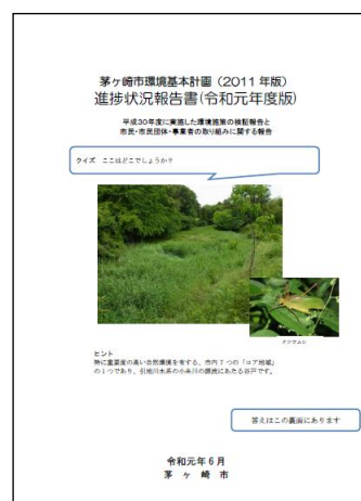
「茅ヶ崎市環境基本計画(2011年版) 進捗状況報告書(令和元年度版)」 (令和元年 6 月発行)