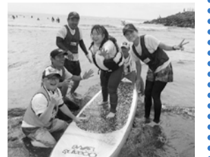
サポートする人もみんな笑顔

また、大人になっても毎日を笑顔で過ごしてほしいという願いから、自分に合った仕事を見つけるための「就労体験」を始めました。活動の見学やボランティア希望の方はご連絡ください。