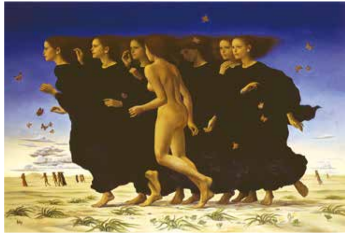
『風』1981年 油彩・カンヴァス 愛知県美術館所蔵

「むきだしの自然」と國領が語った砂丘は、訪れた人々の詩的感覚や人生観を揺さぶり、孤独な瞑想の時へと導いていくような、静寂さに満ちた神秘的な場所です。そのような砂丘に強く心を引かれた國領は、鳥取県の鳥取砂丘や山形県の庄内砂丘、静岡県の中田島砂丘、そして晩年によく訪れた茅ヶ崎海浜など日本各地の砂丘地を取材し、砂のある荒涼とした風景とさまざまな人物、そして鳥たちを登場させる独特の世界を構築しました。