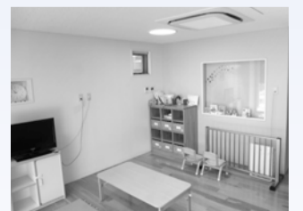
中海岸保育園内にある専用スペース