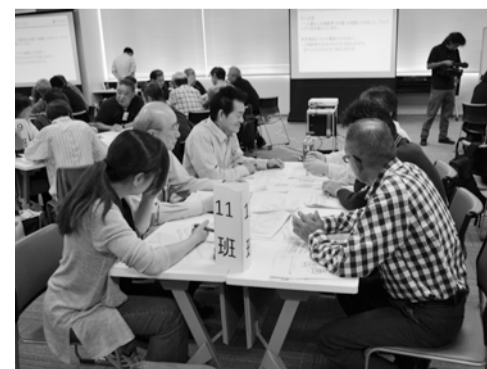
グループワークで知識を深める