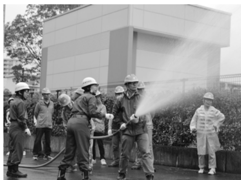
火災に備えた放水訓練

場所 市役所本庁舎4階会議室 申込 1月17日(金)までに市役所防災対策課または所属する自主防災組織の会長へご連絡ください ほか 託児(乳幼児~小学3年生)をご希望の方は申込時にお知らせください