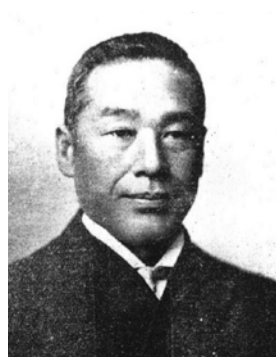
【南湖院アルバム】1913年版より

当初第一病舎だけで始まった南湖院でしたが、敷地が拡大し、次々に新しい病舎が建てられました。周辺では道路の整備や海岸の植林、