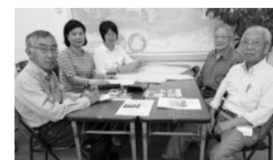
月2回行う編集会議

住み慣れたまちでも、自然や歴史について毎回発見があります。また、インタビューを通じて多くの方の信念や生き方などを知ることができ、やりがいを感じます。自分の考えやまちのことを英語で発信し、人との出会いを楽しみたい方、一緒に活動しませんか。