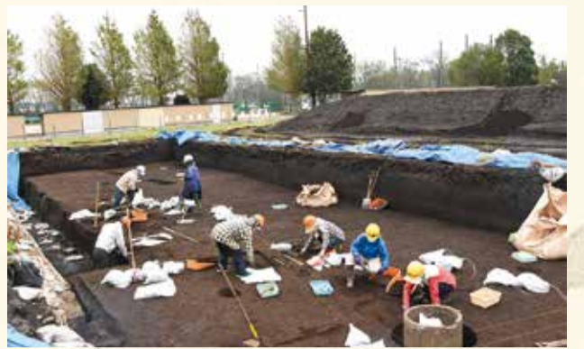
今年の西方遺跡での発掘調査は、9月～12月に毎日10人程度で行われています