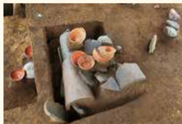
昨年度の七堂伽藍跡発掘調査で発見された土器と寺の瓦。ここで仏事が行われた可能性があります