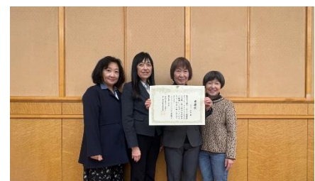
「モリーの会」の皆さん

また、同日には小和田公民館でも活動されている「モリーの会」の方々に、図書館ボランティアの功績により感謝状が贈呈されました。