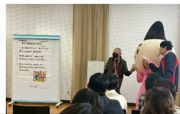
えぼし麻呂と一緒にエンディング♪