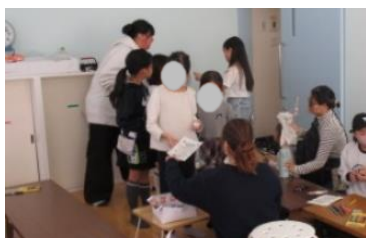
実行委員会企画に新登場！ 缶バッジ作り