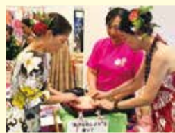
触診モデルでしこりを確認