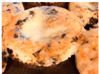
ベーカリー シャンボール

茅ヶ崎産しらすをたっぷり使ったグルテ ンフリー米粉パンです。海苔もグルテン フリー醤油で煮込みました。米油、オー ガニックココナツオイル、てんさい糖、 ロレーヌ岩塩などこだわり抜いた材料で 仕上げました。