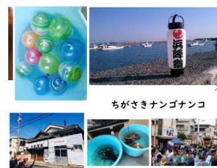
ちがさきナンゴナンコ

今も昔ながらの街並みや文化が息づく「南湖」。知ってるひと知らない人も、まちを丸ごとみんなで楽しむプロジェクトです。情報配信とイベントの開催で、ディープな南湖へみなさまをアテンドします。