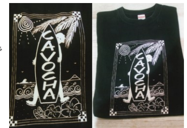
エレガンスネットワーク

茅ヶ崎・ハワイ交流記念事業で設定された商品です。日本のサーフィン発祥の地ハワイと茅ヶ崎をイメージしたTシャツです。