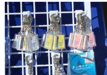
サザンビーチサーフハウス

市内で2007年より販売を開始したご当地キーホルダー。茅ヶ崎市よりナンバープレート等の使用許諾を得て茅ヶ崎ならではの商品開発を行い、地元の方々や来訪者にも喜ばれる商品となっています。