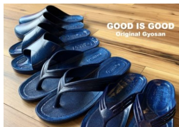
株式会社グッドイズグッド

茅ヶ崎人御用達でおなじみの GOOD IS GOOD 湘南オリジナルカラー湘南ネイビー。ギョサンは50年以上滑りずらいサンダルとして愛されていて、最近ではファッション業界からも注目を集めている。