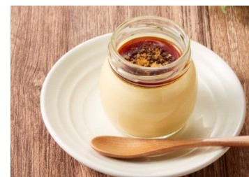
有限会社クライミング

「食べた人を笑顔にする」、「人と人を繋ぐ」をコンセプトにおいしいプリンを茅ヶ崎からお届けします。