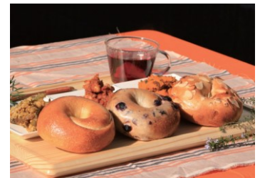
まるなかベーグル

卵・バター・乳製品不使用のまるなかベーグルに、茅ヶ崎産の無農薬野菜、または有機野菜を練りこんだ、オリジナルベーグル。親子で食べられる、無添加、安心、安全な野菜ベーグルです。