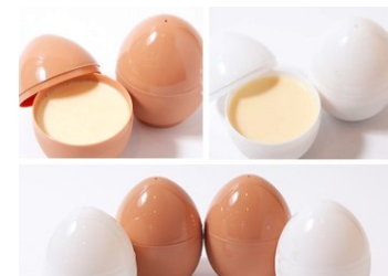
菓子工房グラングラン

なめらかで濃厚なリッチなプリン (半 熟) と昔ながらの少しの固めのサッパリ プリン (固ゆで) ! 底には、摘果藤稔葡 萄を100%使った甘酸っぱいソースが たっぷり入ってます。