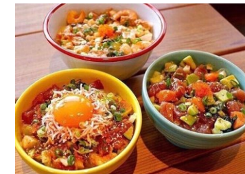
カリフォルニアポキカンパニー

地産地消をベースに茅ヶ崎漁港水揚げの新鮮な魚、朝採れたての新鮮野菜を使用。味付けは元寿司職人のオーナーがマヨネーズ味、キムチ味、醤油味のオリジナルポキボールを開発、インスタ映えのとても良い料理です(写真右奥)。