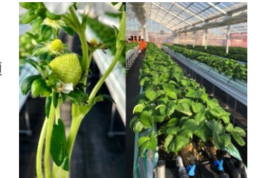
茅ヶ崎ナベヤ苺園

茅ヶ崎の太陽で育った「完熟」のイチゴ。高設栽培式の施設となっていますので、立ったままで収穫が可能です！5種類以上のイチゴが選べます！茅ヶ崎柳島海岸すぐそば。