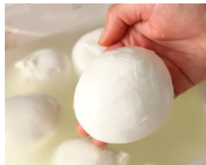
Osteria e bottega S (オステリアエボッテガ イッセ)

茅ヶ崎で唯一の手作りモッツアレラチーズです。原料は神奈川県内のオーガスタミルクファーム産牛乳100%と塩のみです。製造はすべて茅ヶ崎の当工房で行っています。