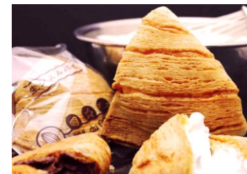
有限会社イル・ド・ショコラ

湘南、茅ヶ崎の海をイメージして創作した貝型のクリームパイ。フランス産プレミアムバターと低脂肪純生クリームのコラボで絶妙の味わい。