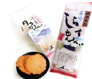
有限会社湘南ちがさき屋十大

茅ヶ崎の海（相模湾）で獲れたしらすをおせんべいにしました。海の香りのおせんべいは、お茶にもお酒にもぴったりです。2枚×10袋入り、軽くて持ち運びやすく、お土産としても最適です。