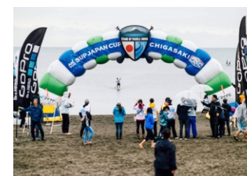
NPO法人SUPUスタンドアップパドルユニオン

初心者から世界ランキング上位のトップレベルの選手まで日本のSUP競技で最も参加人数の多い世界レベルのSUPレース大会です。