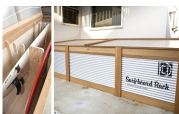
D.PARADISE (ディーパラダイス)

鍵が付けられる仕様なので外置きも安心です。耐久性に富んだハードウッドと塩害にも強い特殊加工の波板を使用。板の大きさや数、縦置き横置き、色んなニーズにお応えできます。(現行の仕様を優先させていただきます。)