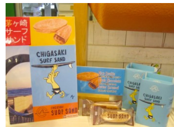
丸和商事・レプラコーン合同会社

湘南タゲリ米を自家製粉し、クッキー生地を作ります。焼き上がった生地に、生チョコとサクサクのカaramelをサンドし、茅ヶ崎サザンCと烏帽子岩をモチーフにサーフボードの形に仕上げます。