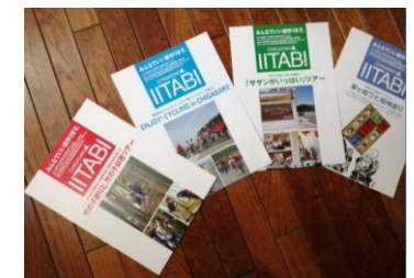
ちがさき体験滞在型旅行推進協議会

みんなでいい旅作ります。4種類のツアー：①竹の子狩りと竹の子料理ツアー ②「サザンがいっぱい」ツアー ③ENJOY! CYCLING in CHIGASAKI ④茅ヶ崎七福神巡り