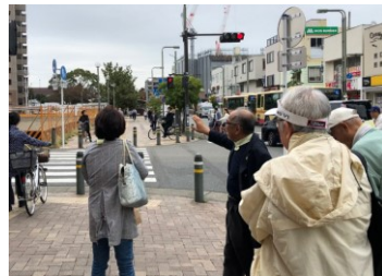
ローカルファースト研究会

茅ヶ崎市民全員ガイド化プロジェクト 茅ヶ崎まちあるき「ちがさんぽ」は市民ガイドを育て人と場所を繋ぐ、商店街を活性化する、ローカルファースト（地域を大切に）をコンセプトとしたお散歩ツアーです。