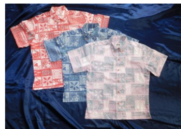
一般社団法人茅ヶ崎市観光協会

茅ヶ崎のクールビズはアロハシャツで！姉妹都市協定締結5周年を記念し、茅ヶ崎市観光協会オリジナルアロハシャツ。茅ヶ崎、ハワイをイメージしたデザインを取り入れています。