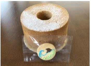
ケーキ工房ムムス

ムムス人気のプレーンシフォンのホールと茅ヶ崎のシンボルをモチーフにしたアイシングクッキーをセットにしました。