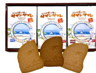
エトアール洋菓子店

茅ヶ崎土産にピッタリ！茅ヶ崎のシンボル、えぼし岩の形のサクリとした上品なサブレです。サザンビーチ、サザンC、サザン通りの3つのサザンから3種類の味（バニラ、ソルト、シナモン）になっております。