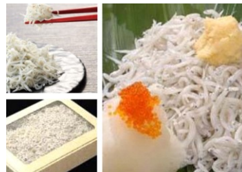
有限会社北村水産

新鮮さをそのまま食卓に、しらす漁から 加工、販売まで新鮮さをそのままに、塩 のみの完全無添加手作り製法にこだわり 老舗としての伝統の味をお届けしていま す。