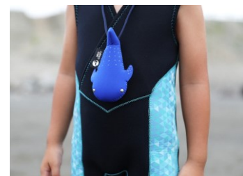
有限会社ティーケイトインターナショナル

ウェットスーツの生地は、クッション性、撥水性、保温性、伸縮性、浮力効果があり高機能な素材です。一般にはなじみがないその生地を使った、海のキャラクター達『KATE'S FRIENDS』は独特なさわり心地が老若男女問わず大人気！