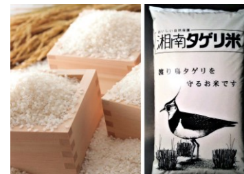
三翠会（さんすいかい）

茅ヶ崎市西久保の水田地帯は水辺の生き物たちが暮らす都市部のオアシスです。5キロのお米を食べると8量の生き物の生息地が守れます。食べる自然保護「湘南タゲリ米」は未来に残したい茅ヶ崎の宝です。