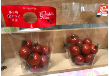
おいしいファーム

ミニトマト一筋35年以上のおいしい農園が味に特化し徹底した栽培管理技術で作る、味濃く風味の良いミニトマトです。