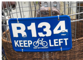
ミニボックスデザイン

湘南茅ヶ崎発の可愛いKEEP LEFT PLATE！自転車の左側通行を推薦するおしゃれなアルミ製オリジナルプレート。自転車のかごやサドルの下につけるほかインテリアとしても人気！