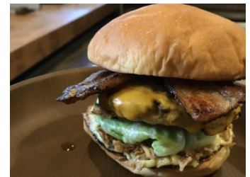
SUBURBAN GRILL（サバーバングリル）

パンズ、パティ、ベーコンまで全てが手作り!?!味はもちろん、レタスの食感など、こだわりの詰まったバーガー!! スモークベーコンは一週間かけ調理し、分厚く切りました!ぜひ味わってみてください。