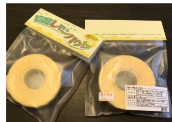
Baumkuchen Heim 松波樹

直火一本焼き元来製法のバウムクーヘンは、ギュッと締った焼き上がりで口の中でほどける食感。濃厚な乳と発酵バターを使用し、自然な環境で栽培されたレモンの表皮と果汁をアクセントに芳醇な風味のハーモニー。