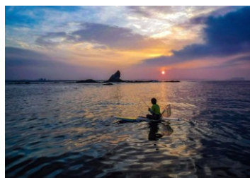
Hosoi Surf&Sports (ホソイサーフアンドスポーツ)

SUPとフィッシングを組み合わせた新しいスポーツフィッシング「SUPフィッシング」です。SUPも釣りも未経験の方でもインストラクターが安全に楽しめるようご案内します。自然豊かな茅ヶ崎の海で大物を釣りましょう！