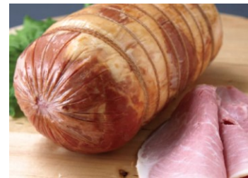
有限会社ハム工房ジロー

現代のハムと違いジローのハムは添加物 に頼らず作り続けている。100年続くドイ ツ製法で造られたハムは長期熟成による” 肉の旨み”、直火式スモークの”本物の香 り”が堪能できます。