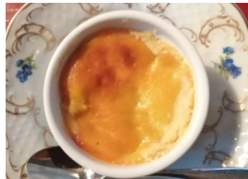
スマイルフーズ株式会社

さつま芋であなたは綺麗になる!! さつま芋が持つ「食物繊維」の働きにより腸内環境が整い、便秘解消、ダイエット効果、高血圧予防、コレステロール値低下等に繋がります。あなたの美容・健康長寿をお約束します。