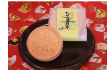
有限会社浜田屋菓子舗

茅ヶ崎のシンボル、えぼし岩の見える茅ヶ崎の浜の風景を象った最中です。販売から30年近く、原料・製法にこだわり作り続けています。