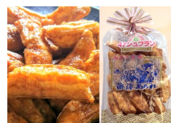
湘南せんべい製造元 有限会社三河屋

よしもと47シュフラン 金賞受賞。フッ クラと揚げた揚げせんにお砂糖と蜂蜜の 醤油だれで甘く仕上げました。お子様か ら御年配の方までお楽しみ頂け、約50年 以上御愛顧を賜っております。