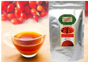
プロヴァンスガーデン

夏、茅ヶ崎の強い日差しからお肌を守る、体内からの日焼け対策はビタミンCの摂取がとても大切！プロヴァンスガーデンの"実を食べるローズヒップティー"で天然ビタミンCを取り込んで日焼けしにくいお肌へ。