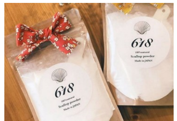
レルムナチュレジャパン合同会社

ホタテの貝殻を3年以上天日干しをし高温で焼き上げたパウダーです。残留農薬の除去、洗濯、掃除、入浴剤として多様にお使い頂けます。使い終わったパウダー水は排水管や河川を綺麗にしながら自然に還ります。