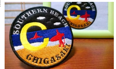
有限会社ライオン堂

ひとつひとつ丁寧に2万回縫いた自社製作の刺繍ワッペンです。裏地はアイロンでお手持ちの布製品に接着できるように仕上げられています。刺繍ならではの表現による湘南・茅ヶ崎の思い出を是非！