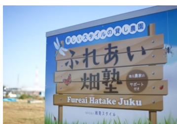
NPO法人湘南スタイル

新しいスタイルの貸し農園「ふれあい畑塾」。農家指導、種・苗無償提供、農機具完備、収穫サポート、交流会、SNS情報交流など、手厚いサポートが人気の企画です。