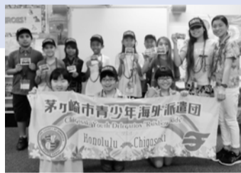
姉妹都市間の架け橋に

姉妹都市ホノルル市・郡への青少年海外派遣事業を実施します。現地小学生との交流やホノルルの文化を体験することで、国際人としての広い視野を持った人材の育成を目指します。