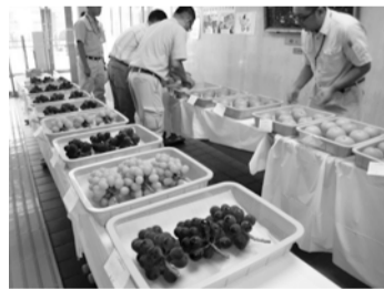
【農業水産課農業担当】

市内の農家が丹精込めて生産したぶどう・梨の品評会を行います。上品な口溶けのぶどうと、シャキシャキとした食感あふれる梨の直売も実施します。地元でとれた旬の果物を味わってみませんか。