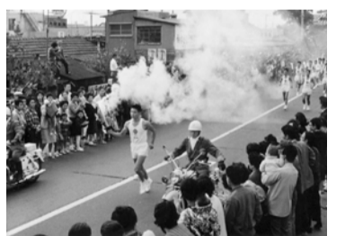
1964年東京オリンピック聖火リレー(個人蔵)

1960年代の茅ヶ崎の歴史に焦点を当てた展示と市史ブックレット制作にあたり、当時の茅ヶ崎の歴史に関する写真とエピソード、生活に関する資料を募集します。 【文化生涯学習課文化推進担当・市史編さん担当】