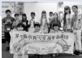
姉妹都市間の架け橋に

姉妹都市ホノルル市・郡への青少年海外派遣事業を実施します。現地小学生との交流やホノルルの文化を体験することで、国際人としての広い視野を持った人材の育成を目指します。