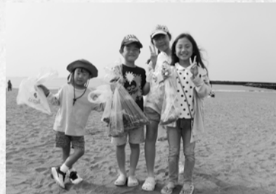
6月の美化キャンペーンには2088人が参加 全7会場で5.34t回収