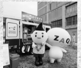
昨年はキャラクターも参加