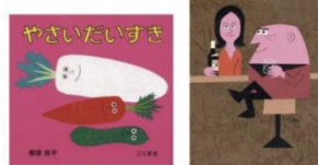
大きな面を色にできる