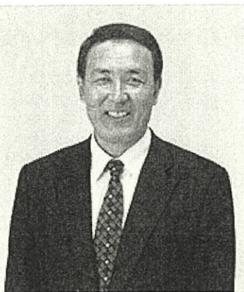
茅ヶ崎市議会議員