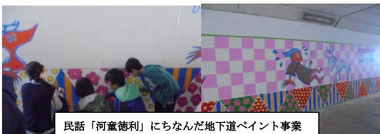
民話「河童徳利」にちなんだ地下道ペイント事業 (平成 28～29 年度実施)

西久保地区では、地域の皆様の協力を得ながら、民話「河童徳利」にちなんだ取り組みを進めています。