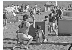
スポーツとして注目を集める雪合戦を砂浜で

ビーチ DE 福釣り★ ピストン砂浜ボクシング★ フレスコボール 第25回ビーチサッカー大会(25日) 桑田佳祐杯第17回パドルレースコンテスト(25日) ビーチサン跳ばし選手権(25日)★ ちびっ子ラグビー教室(26日)★ 第4回ビーチラグビー大会(26日) 第20回SKIMBOARD CONTEST(26日) ビーチ雪合戦(26日)★