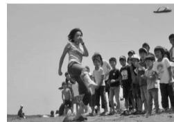
毎年大人気! 茅ヶ崎発祥のビーチサン跳ばし