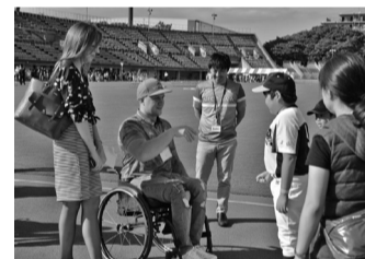
昨年来日したパラアスリート

やり投げ・砲丸投げ・円盤投げなどの投てき種目や、幅跳び、100m走など7人の選手が練習を行う予定です。練習中は静かに見学しましょう。