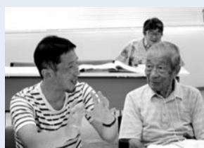
未来に思いを馳せて