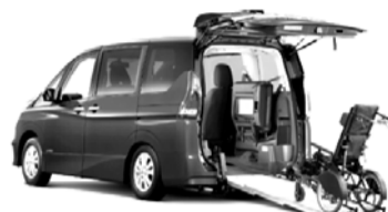
セレナ チェアキャブスロープタイプ

日時 12月12日(水)10時～11時30分 (9時30分に市役所本庁舎前集合) 場所 株式会社オーテックジャパン 本社・工場(萩園) 対象 18歳以上の方20人(申込制(先着)) 申込 11月19日(月)～ ☎