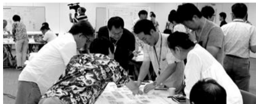
【企画経営課企画経営担当】 「ちがさき未来会議」ではグループごとに議論

2021年度から始まる次期総合計画*の策定は、市民のみなさんに参加していただきながら検討しています。7月～9月に開催した市民ワークショップ「ちがさき未来会議」では、公募の32人と市職員が一緒になって、目指す理想の都市像とそれを実現するための道筋を議論しました。