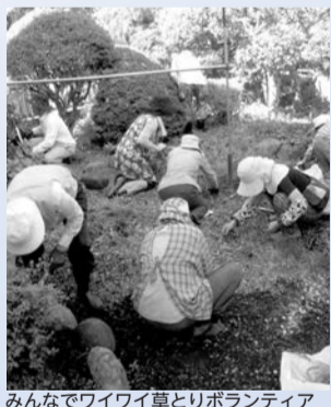
みんなでワイワイ草とりボランティア

日時 12月15日(土)13時30分～15時30分 場所 市役所本庁舎会議室1～5 内容 ボランティアセンターって？(概要) ボランティアセンターの活動を通して(実体験をもとに)