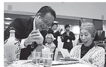
市長から敬老祝金などの贈呈

日時 10月5日(金) 14時30分～16時 場所 市役所本庁舎 市民ふれあいプラザ 内容 三線、ギター演奏 くす玉でお祝い