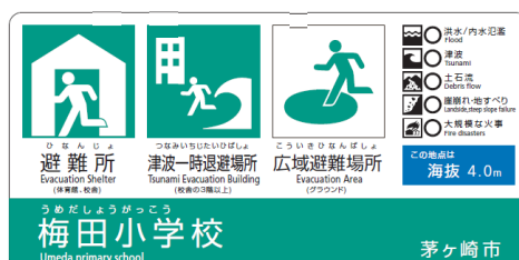
避難所兼避難場所