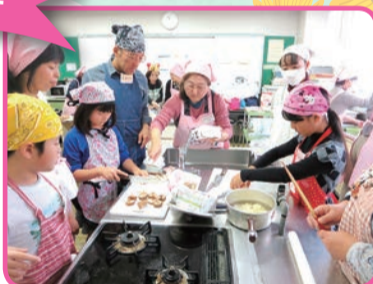
普段作らない料理に挑戦