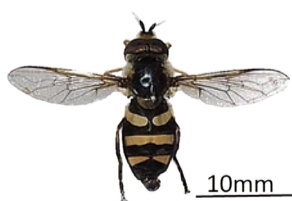
ヘリヒラタアブのオスの標本

●まだ未解明なことも ヒラタアブの仲間は身近で見ることができませんが、一年に何回発生して寿命はどのくらいなのか、メスは卵をいくつ産むのか、ホバリングは気温や風向き、光の強さなどのような条件で高さを決めてどのくらい続けられるのかなど、分かっていないことがまだまだ多くあるといわれています。