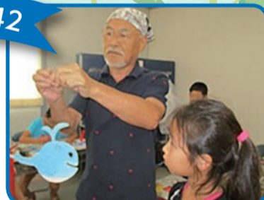
部屋のインテリアとして人気のモビール