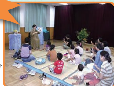
話の世界に入り込めると人気