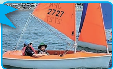
人気の2人乗りヨットを体験