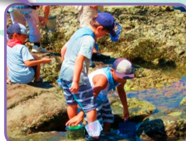
潮だまりをのぞき生き物を探す子どもたち