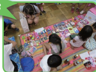
にぎわうこどもフリーマーケット