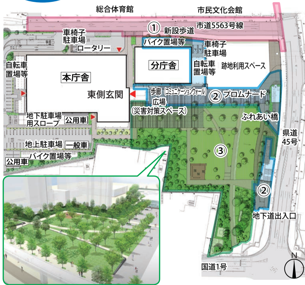
整備後の広場(イメージ)

※行政拠点地区の再整備 市の中心市街地に位置する市役所や市民文化会館、総合体育館などの一帯を行政拠点地区と位置付け、安全・安心の拠点づくり、文化・生涯学習の拠点づくり、中心市街地の活性化と市民生活の利便性向上の3つのコンセプトに基づき、既存の公共施設の再整備と新たな機能の拡充を行います。