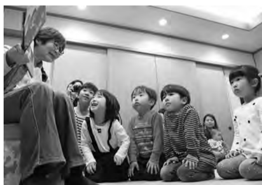
前のめりになって聞き入る子どもたち

小学生までの子どもを対象に、毎月数回「おはなし会」を開催しています。職員やボランティアがさまざまな絵本を読みます。「普段は読まない種類の本に興味を示していて、こんな本が好きだったのかと新たな発見があります」(保護者30代女性)。絵本だけでなく、手遊びなど楽しいプログラムもいっぱいです。お気軽にご参加ください。