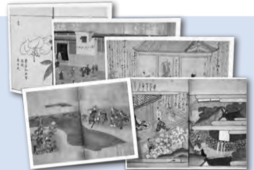
鮮明なデジタル化資料

日本で発行された全ての書籍・雑誌などを保存している国立国会図書館。このサービスでは、所蔵している絶版等の理由で入手が困難なデジタル化資料150万点以上を閲覧・複写することができます。資料の目次や雑誌の記事タイトルからも検索できるので、思いがけない資料との出会いがあるかもしれません。