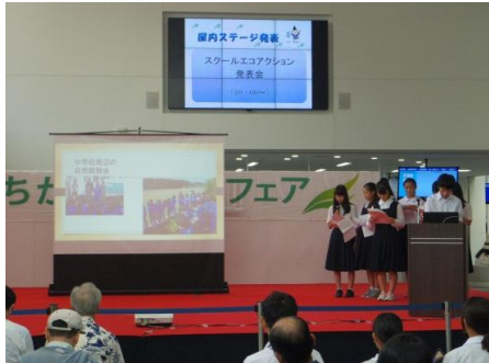
スクールエコアクション発表会

当日は、様々なステージイベントや展示、ワークショップなどを通し、一人一人が環境を良くするためにどんなことができるのか考えるきっかけとなりました。