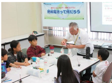
おもしろ環境教室