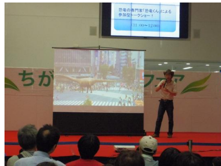
恐竜の専門家「恐竜くん」によるトークショー