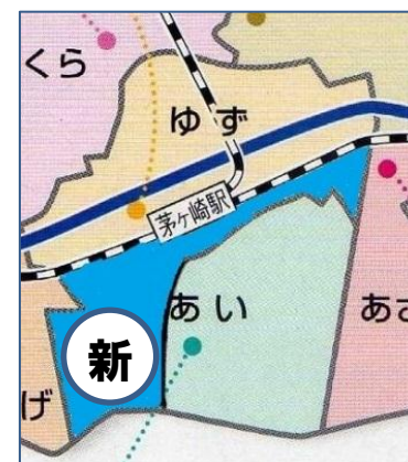
D案 新たに整備する