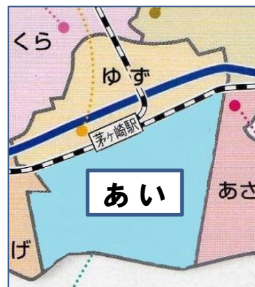
C案 あいに編入する