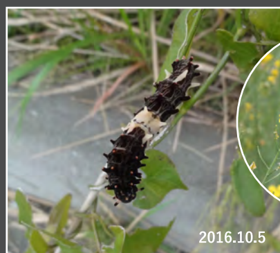
▲ ジャコウアゲハの幼虫（お菊虫）