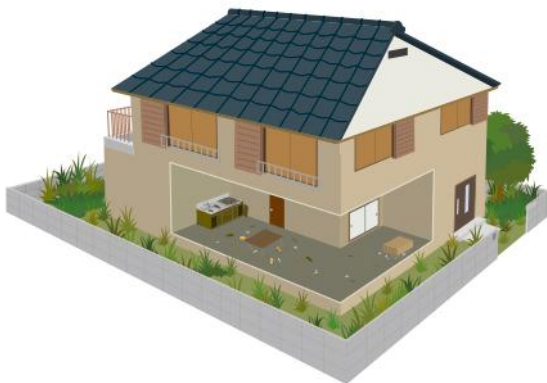
【誰も居住していない空き家】