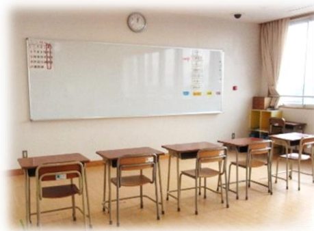
そだちの教室（鶴が台小学校）