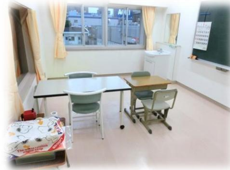
ことばの教室（梅田小学校）