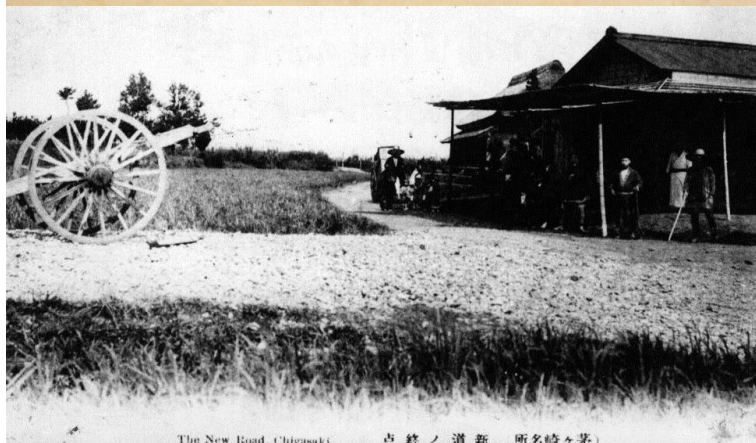
The New Road, Chigasaki 点終ノ道新 (所名崎々茅)