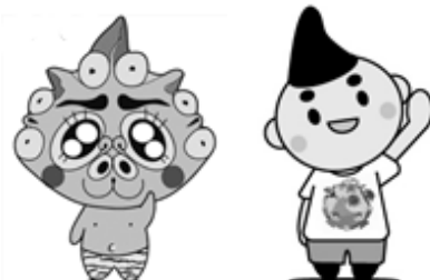
寒川町文化財学習センターキャラクター つりてくん

○ このチラシは、市町村振興宝くじ「サマーチャンポ宝くじ」の収益金が充てられています。