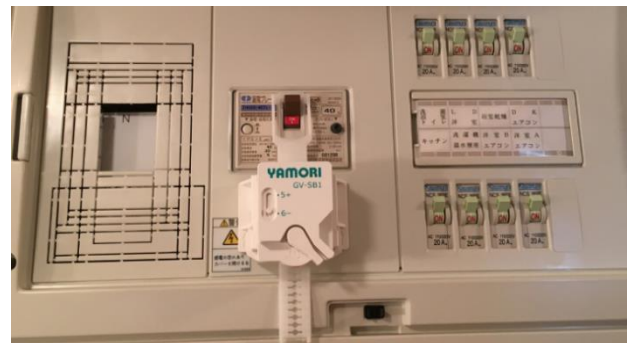
簡易タイプ設置例