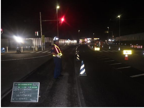
(推薦理由に係る写真1)