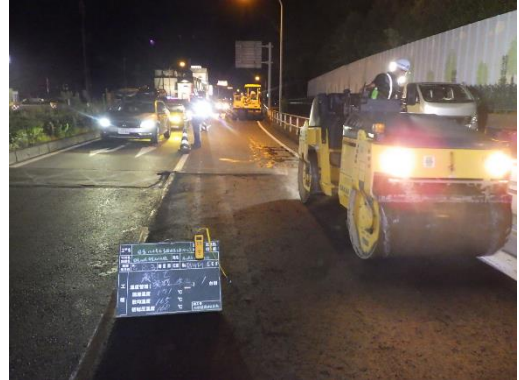
(推薦理由に係る写真2)