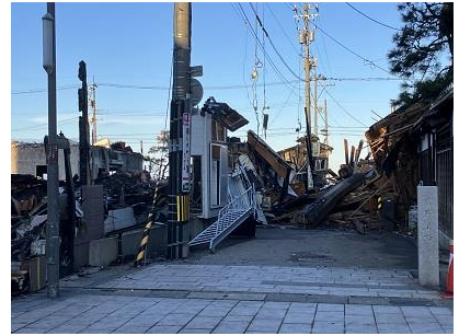
神奈川県より派遣された判定士が撮影した被災写真（輪島市）

今回の地震で多くの被害が出ております。石川県内の5市6町の被災建築物応急危険度判定の実施結果は、以下の通りです。石川県からの要請に基づき、神奈川県からも被災建築物応急危険度判定業務の支援のため、建築職10名（被災建築物応急危険度判定士：神奈川県6名、横浜市2名、川崎市2名）が派遣されました。