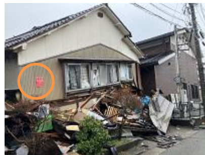
○ 応急危険度判定の判定結果