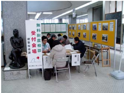
建築なんでも相談（耐震相談）

お住まいの耐震性について不安はありませんか？ ご自宅がいつ建築されたのか調べてみましょう。 昭和56年5月31日以前に工事に着手された木造住宅にお住まいの方は、是非一度ご相談を受けることをお勧めします。なぜなら、その日を境にして耐震基準が大きく異なるからです。 協議会では、市に登録された「耐震診断士」が無料で相談に応じる「建築なんでも相談」を実施しています。相談予定日は裏面をご覧ください。 会場では図面をもとに簡易診断を行います。 相談の結果、耐震性に不安が残る場合は現地調査を含めた「一般診断」を受け、より詳細な耐震性を把握することをお願いしています。この「一般