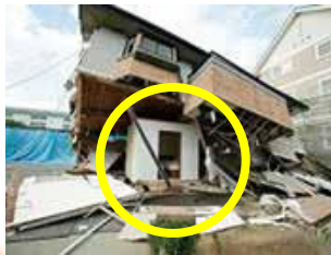
耐震シェルターの一例

地震で住宅が倒壊しても、寝室や睡眠スペース等に安全な 空間を確保し、命を守る装置 です。安全な空間は、睡眠スペース周りに限られますが、短期間での設置が可能で、費用も抑えられます。