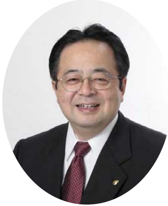
茅ヶ崎市長 服部 信明

本市では、平成 8 年に「茅ヶ崎市緑の基本計画」を策定し、本市が定める将来都市像「自然と人がふれあう心豊かな快適都市 茅ヶ崎」の実現に向けてみどりの保全や、緑化の推進に取り組んでまいりました。