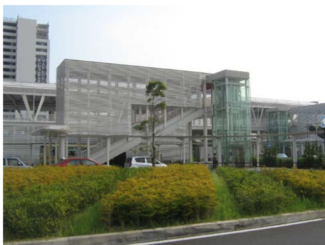
辻堂駅本屋口北側