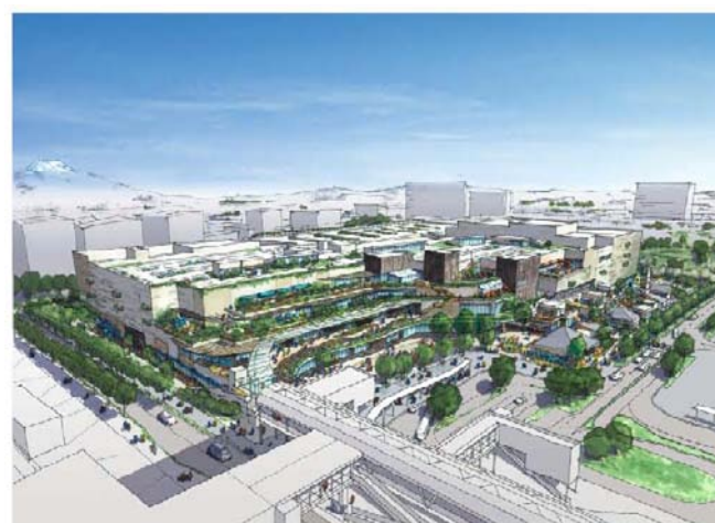
湘南 C-X（商業施設）イメージ図