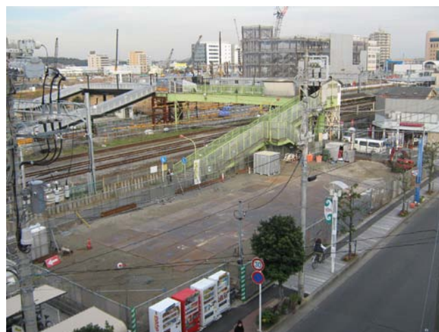
辻堂駅西口南側（整備中）