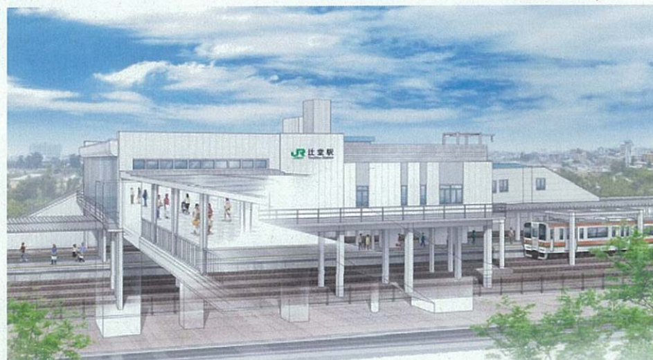
辻堂駅 本屋口駅舎外観透視図