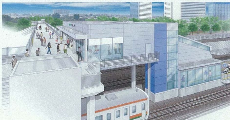
辻堂駅 西口駅舎外観透視図