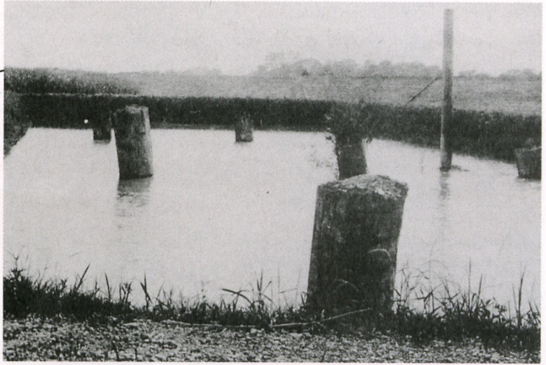
最初に造られた保存池「写真集 緑萌える日々」から