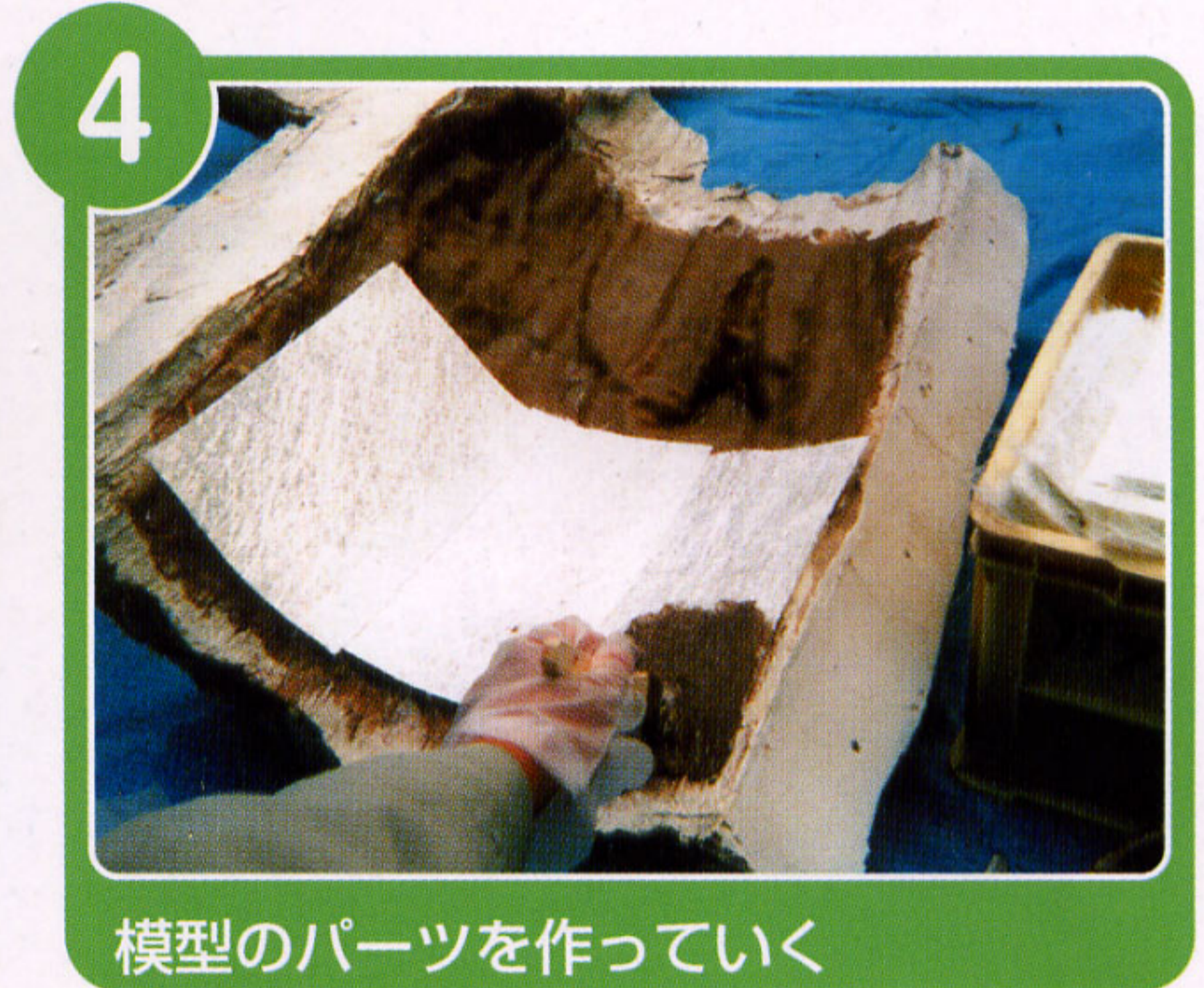
模型のパーツを作っていく