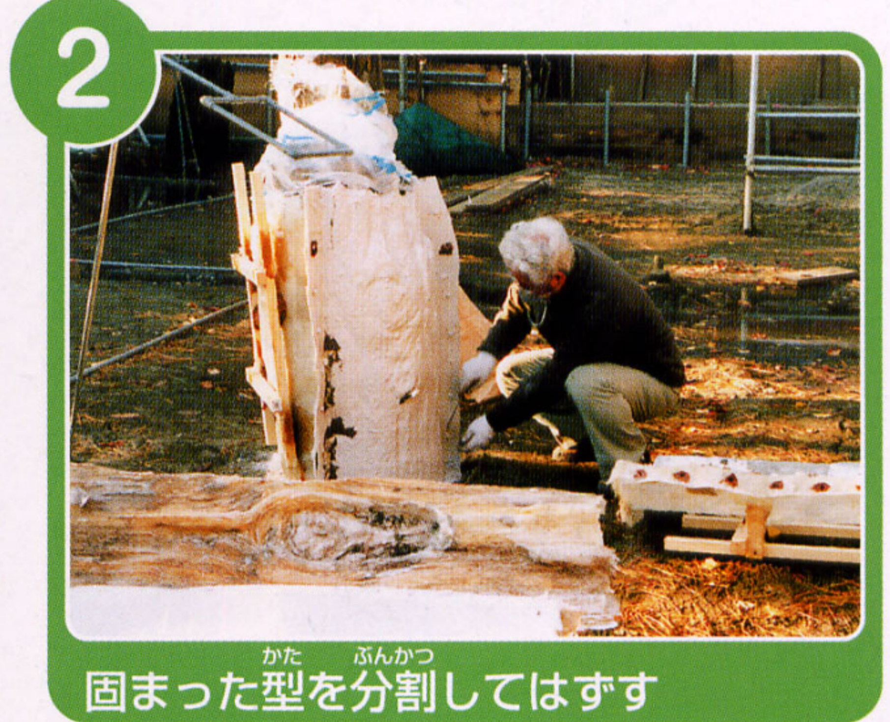
かた ぶんかつ 固まった型を分割してはずす