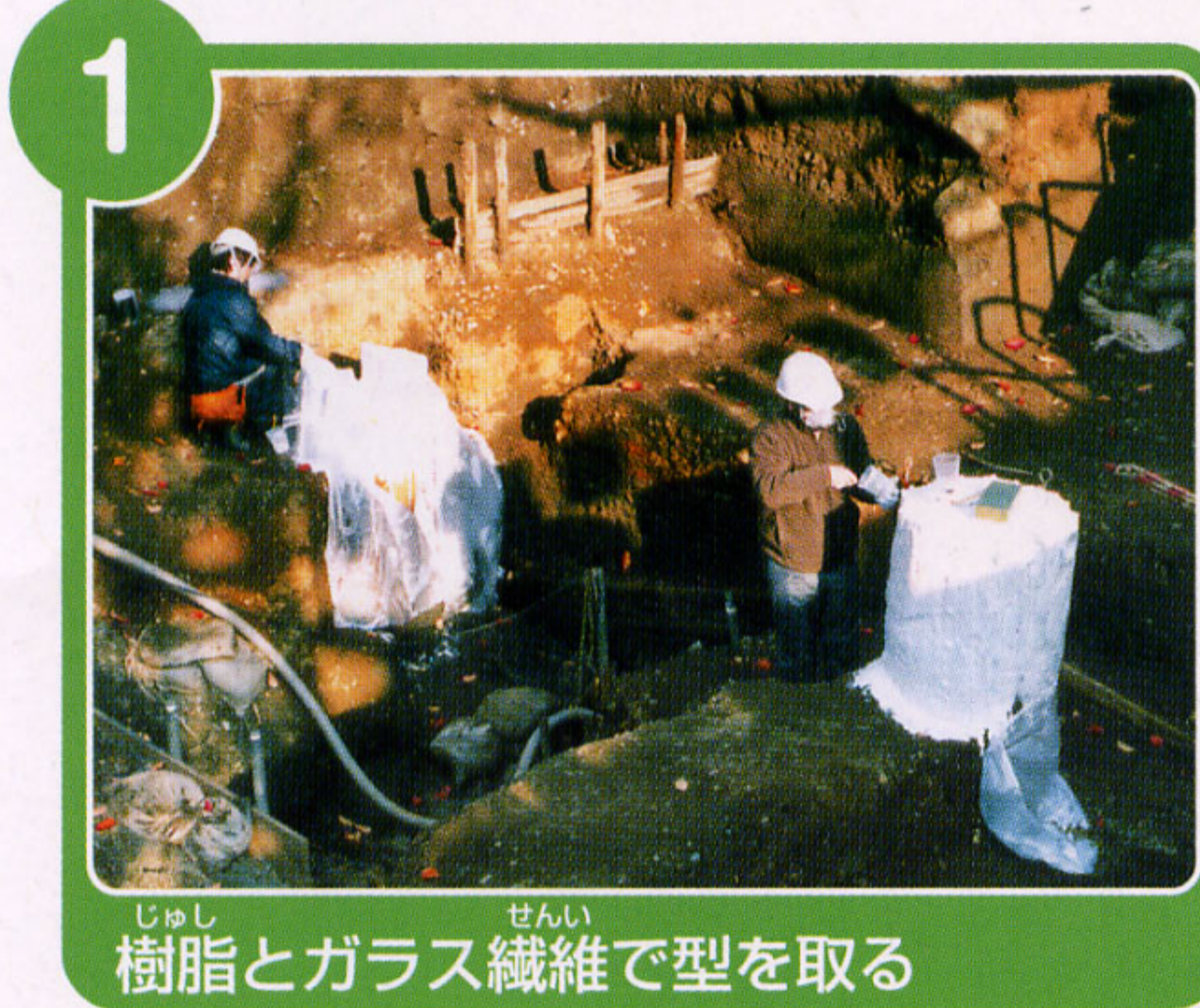
じゆし せんい 樹脂とガラス繊維で型を取る