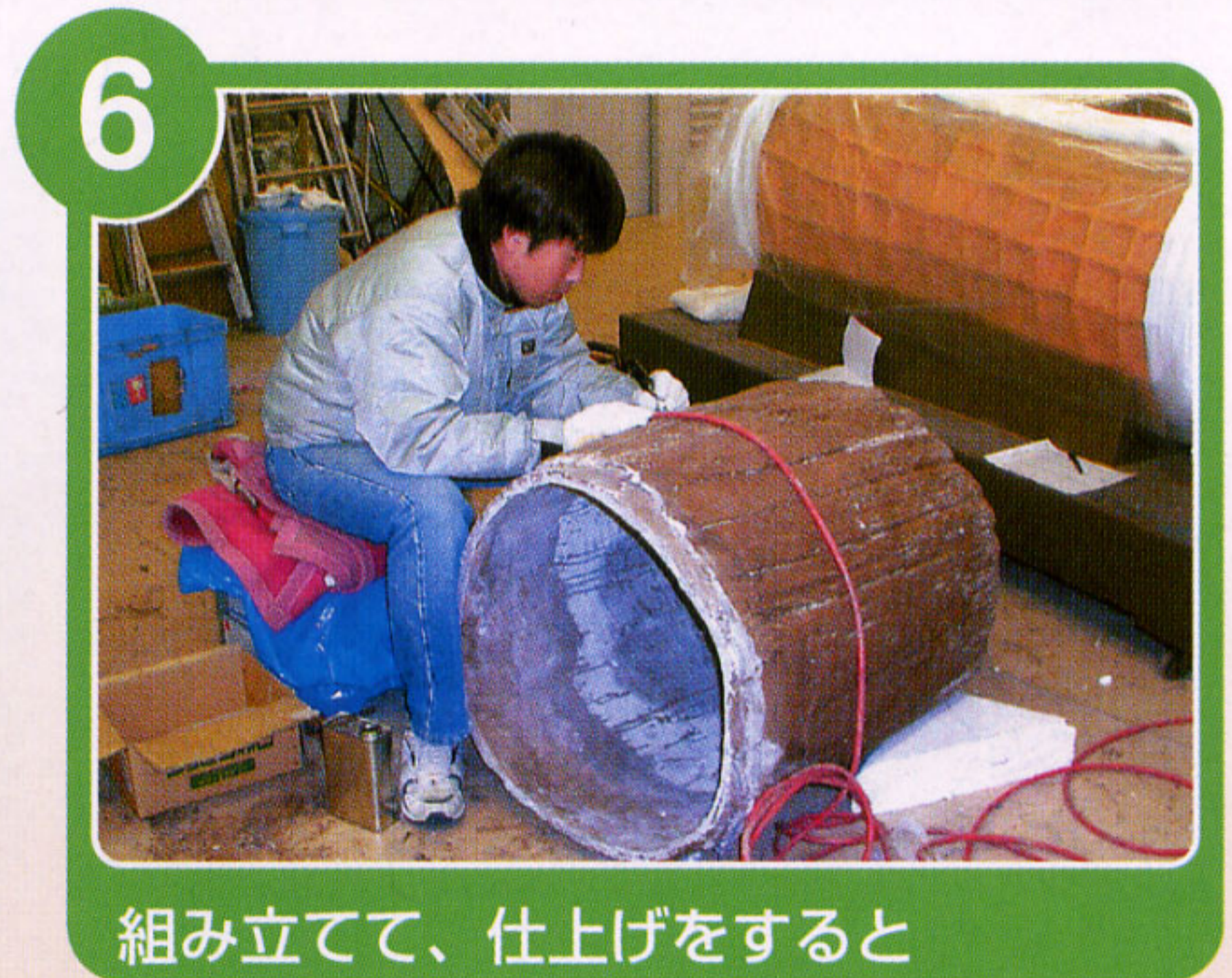
組み立てて、仕上げをすると