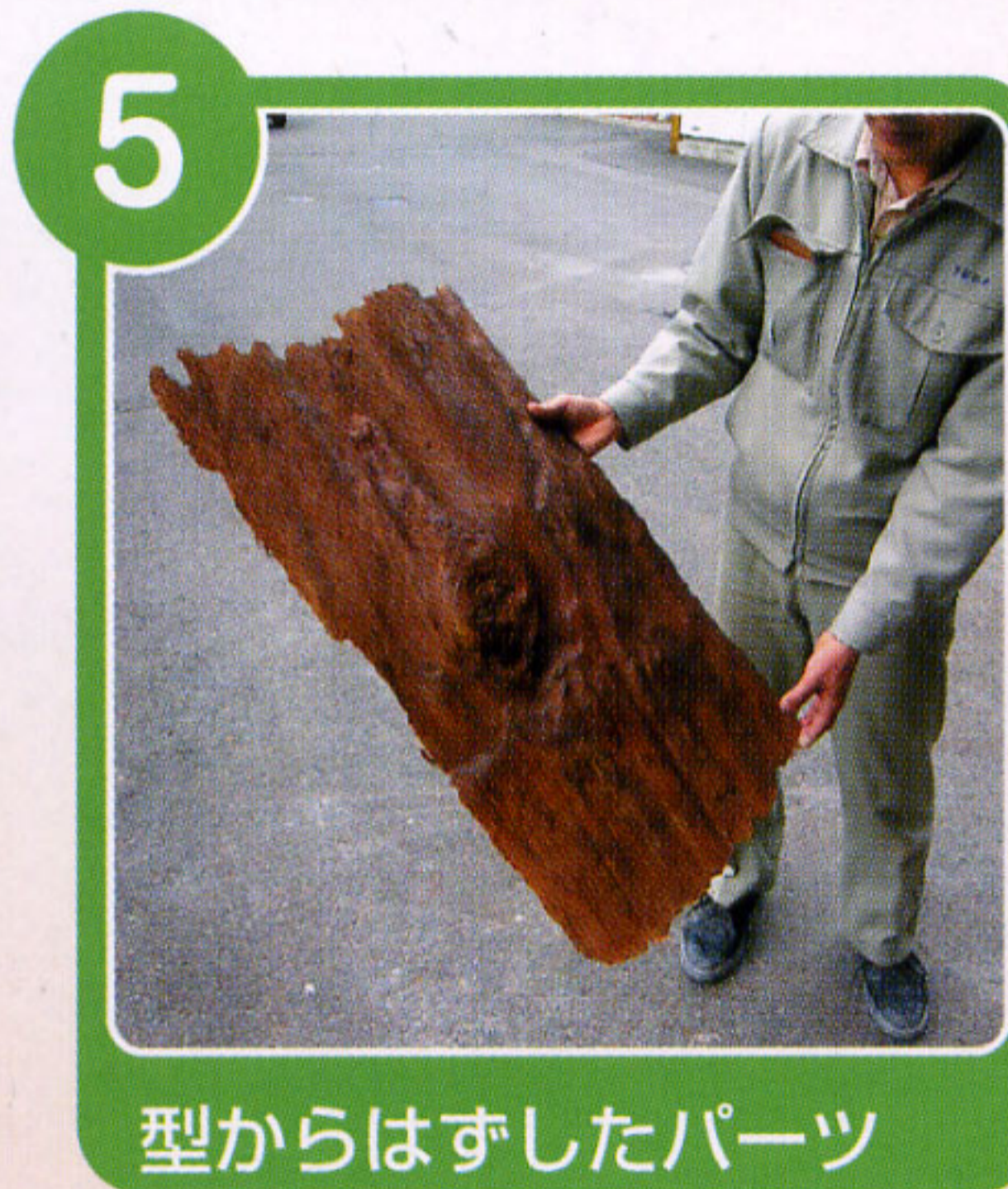
型からはずしたパーツ