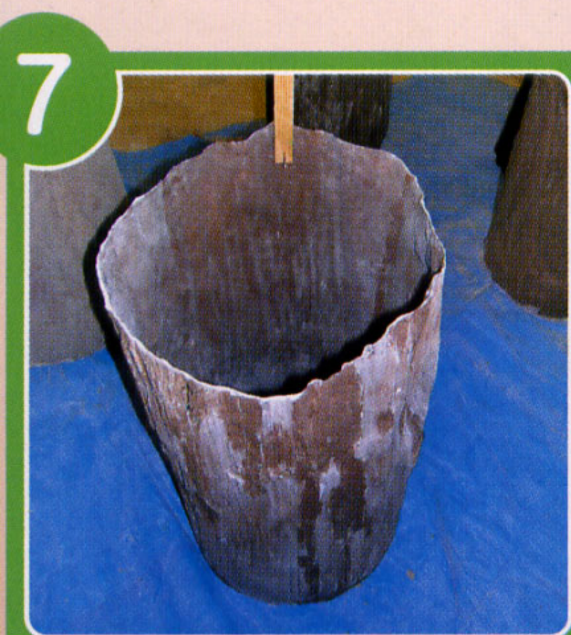
くうどう 中は空洞のまま、模型は完成。比較的軽くて、じょうぶです