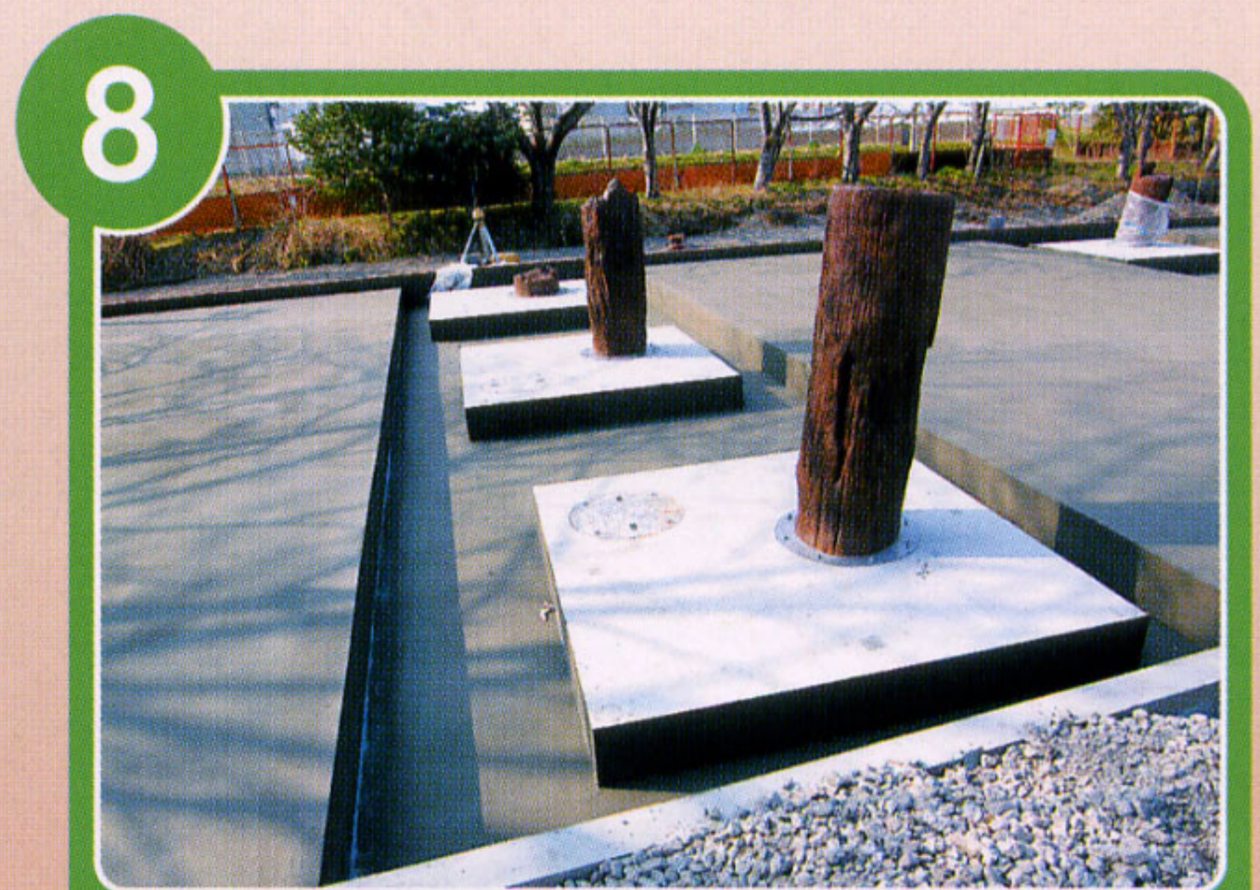
まうえ なお 実物の真上に立て直しました。