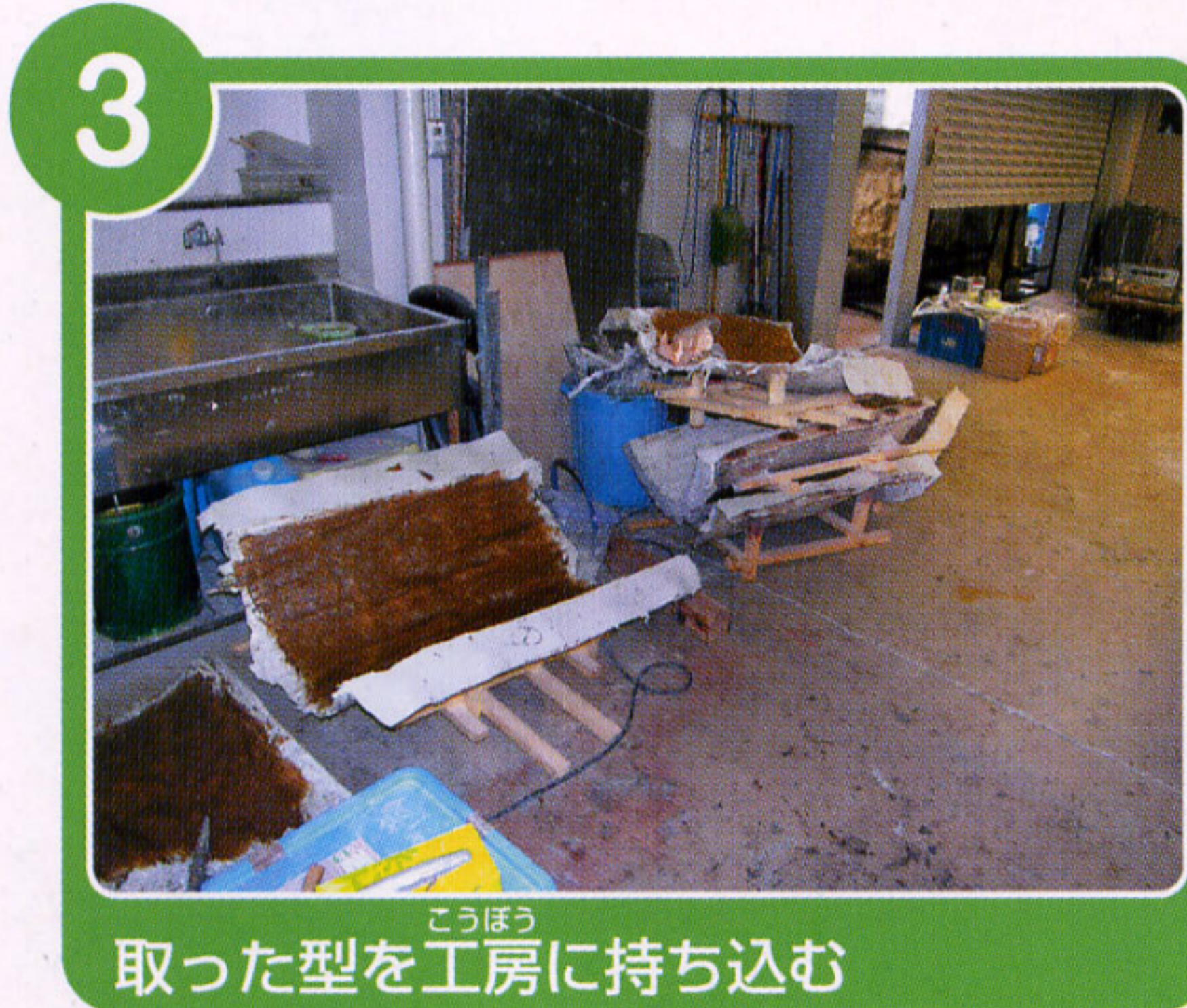
こうぼう 取った型を工房に持ち込む