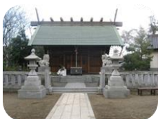
歩道橋の先に本殿

新湘南バイパスで神域が分断され歩道橋を渡って本殿に行きます。水道道のそばにある梵鐘は満蔵寺（廃寺）のものです。