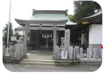
熊野神社 万治元年(1658)越前守忠相の父忠高が紀州熊野権現を勧請したといわれている。