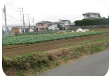
高台辺りが手白塚