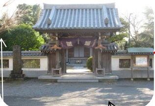
本在寺 (大岡越前守が浄見寺に行く時に休んだといわれている。)