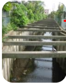
カモが泳ぐ赤羽根川