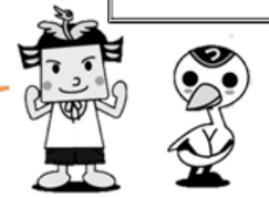
つるたろう つるみちゃん