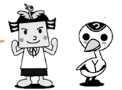
つるたろう つるみちゃん