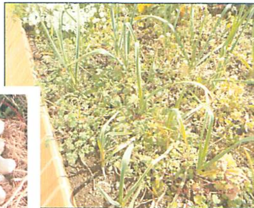
元気いっぱいがんばっている野菜たち