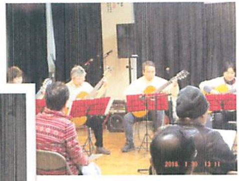
アルファギタークラブ