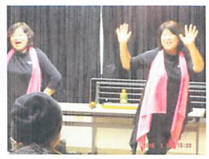
サンシャインシンガーズ