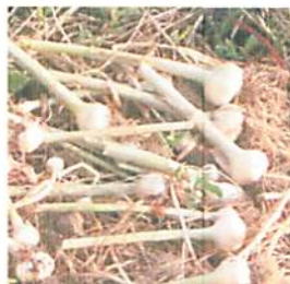
こんな収穫を夢見て