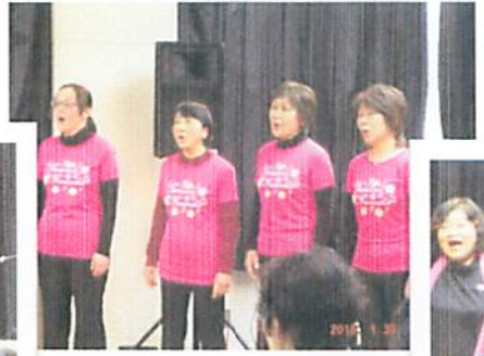
鶴嶺フラウエンコール