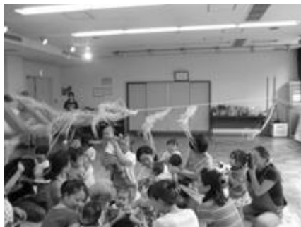
↑『ごろごろびよんリズムであそぼう!』で大盛り上がり。

最後はみんなで『星に願いを』をハンドベルで演奏。にぎやかで、なごやかで、楽しい夏のひと時でした。