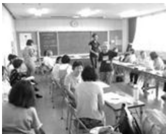
↑活動歴29年。先人の志を受け継いで…。

この講座は全部で六回なので、11月の最終講座には相当なレベルになっているものと期待しています。