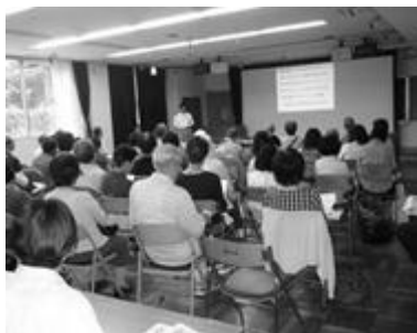
↑講演終了後には、活発な質疑応答が展開された。

講演会当日は、50名を超える参加者で、先生の臨床に基づく具体的な分かりやすい講演が進められました。認知症をますます正しく理解し、地域での協力体制を築くことが大事であることについて、