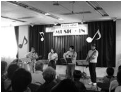
↑コンサート55回と公民館30周年を記念して、文化会館小ホール

会場: 茅ヶ崎市文化会館小ホール 出演予定: マリンブルー湘南(ハーモニカ)/エストレージャス(フルクローレ)/鶴嶺フラウエンコール(コーラス)/サンシャイン・シンガース(アカペラ)/オカリナ湘南(オカリナ)ほか